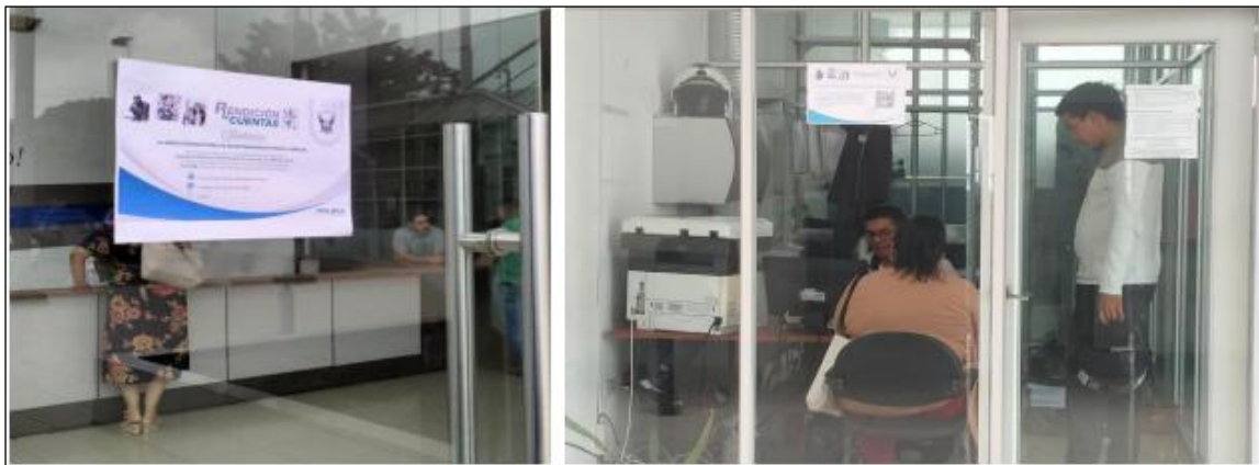
Infografía relacionada al Informe Preliminar el Formulario del Proceso de Rendición de Cuentas

Las actividades ejecutadas por el Departamento de Comunicación Organizacional y Sección TIC's de esta Dirección, se dieron a conocer de manera oportuna mediante el Informe Nro. PN-DNPJ-CORG-2025-042-INF, del 03 de julio del 2025.