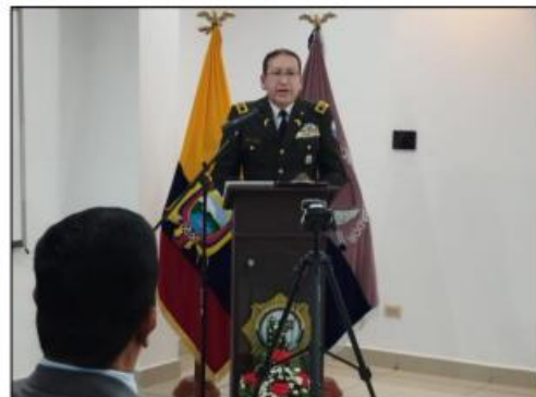
Fotografías del evento de Rendición de Cuentas

Sobre el evento desarrollado referente a la Audiencia pública de deliberación presencial y virtual de Rendición de Cuentas de la Gestión Administrativa y Operativa de la DNPJ, periodo 2024, se elaboró el respectivo documento – Acta Plenaria