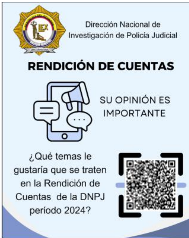
Infografía creada para la difusión

El formulario creado para la recepción de opinión ciudadana, se ha difundido por distintos medios, tratando de maximizar su alcance: con el propósito de registrar los temas de interés colectivo afines a nuestro servicio y que puedan tratarse en la Rendición de Cuentas de esta dependencia.