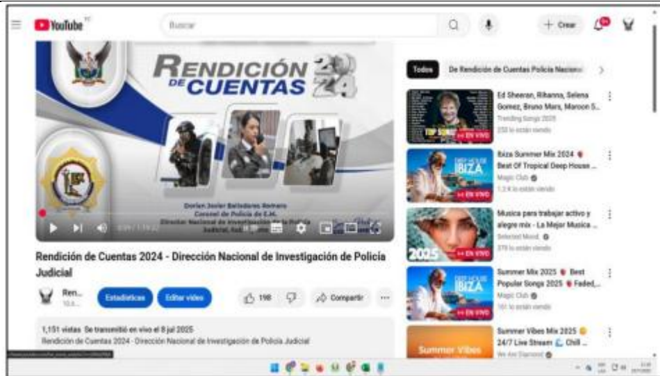
Evento de Rendición de Cuentas en la Plataforma YouTube

Las actividades ejecutadas por el Departamento de Comunicación Organizacional y Sección TIC's de esta Dirección, se dieron a conocer de manera oportuna mediante el Informe Nro. PN-DNPJ-CORG-2025-047-INF, del 23 de julio del 2025.